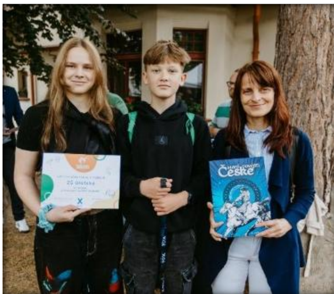
Setkání vítězných týmů participativního rozpočtu, květen 2025