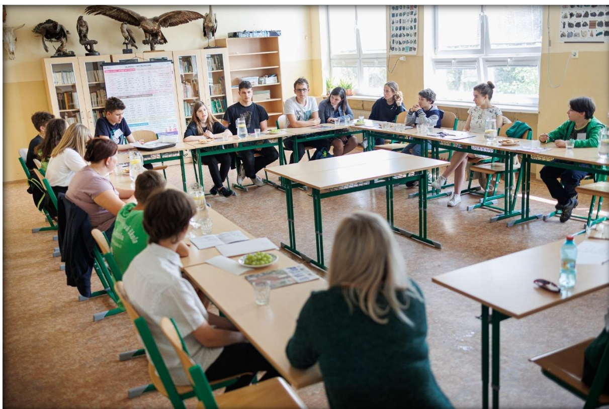
Jednání Sněmu žáků Desítky, 2022

Klíčový výstup a příklady realizovaných aktivit: Organizace akcí pro vrstevnickou veřejnost – sportovní dny, komunitní festivaly a dobrovolnické aktivity žáků. Jednání s politiky s předáním výsledků participačních aktivit (primátor Hl. M. Prahy, ministr životního prostředí, pražský radní pro školství)