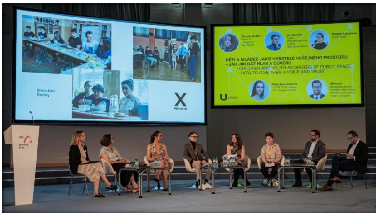
Zástupce Sněmu žáků na mezinárodní konferenci URBIS BRNO, červen 2025

Klíčovým prvkem úspěchu byla spolupráce širokého spektra partnerů: škol, úřadu, rodičů, místních organizací, odborných institucí i národních sítí. Praha 10 aktivně sdílela své zkušenosti a inspirovala další města a městské části. Významná byla i účast mládeže na celostátních akcích a zapojení do odborných panelů a diskuzí, což posílilo prestiž městské části a otevřelo nové možnosti rozvoje participace.