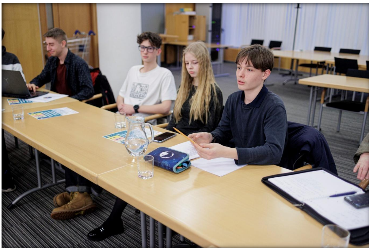
Prezentace výsledků 1. Fóra mladých Radě MČ Praha 10, únor 2024

Zároveň tyto aktivity pomáhají budovat vztah mladých lidí k místu, ve kterém žijí. Ve sledovaném období vznikl ucelený systém vzájemně propojených programů, které umožnily mládeži reálně ovlivňovat prostředí škol i veřejný prostor, přičemž došlo k významnému rozšíření zapojených subjektů a posílení spolupráce napříč komunitou.