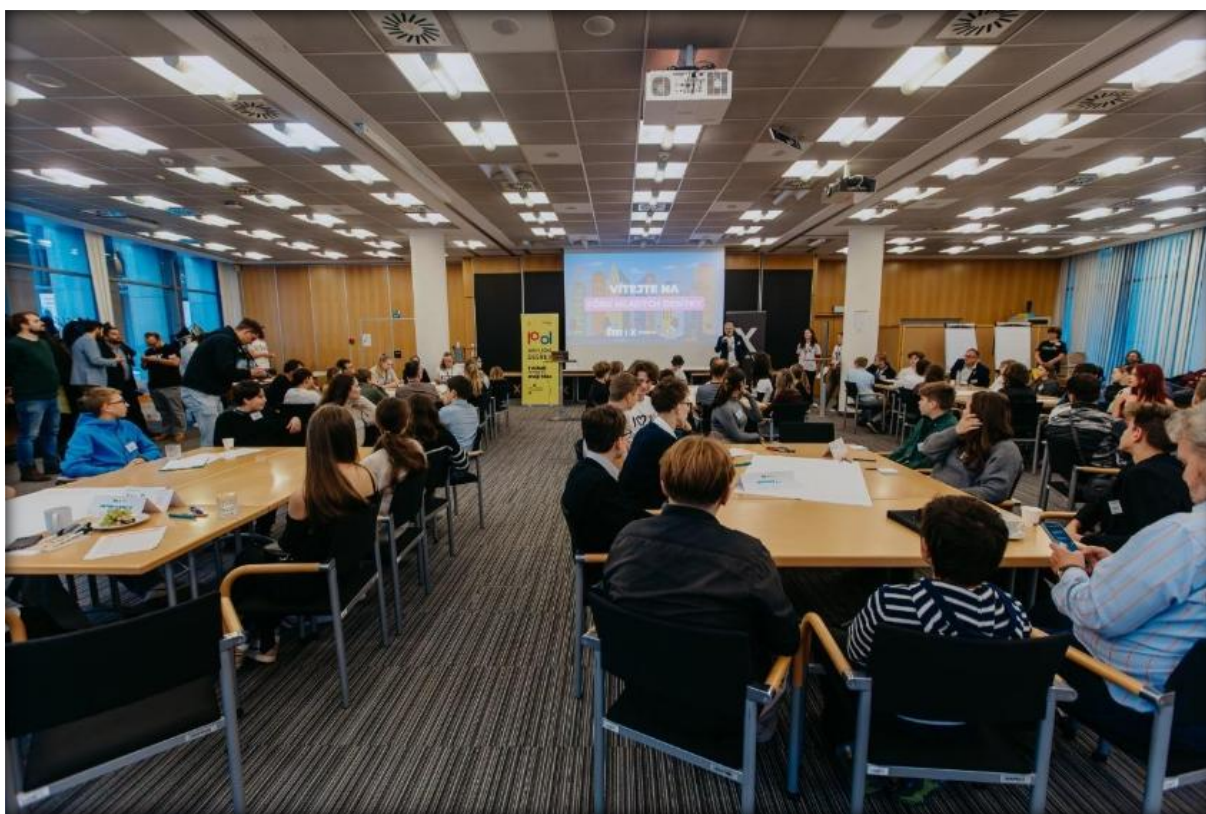
Fórum mladých, listopad 2025

Klíčový výstup a příklady realizovaných aktivit: Výběr prioritních projektů prostřednictvím diskuzí a anket, do kterých se zapojily stovky studentů. Koše na tříděný odpad v Malešickém parku.