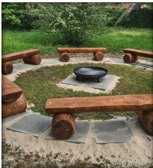
Posezení s ohništěm – vítězný projekt 3. ročníku Mojí stopy, ZŠ Nad Vodovodem, školní rok 2023/2024

Klíčový výstup a příklady realizovaných aktivit: Realizace desítek projektů na školách – od sportovišť přes úpravy tříd až po školní altány a zázemí pro relaxaci.