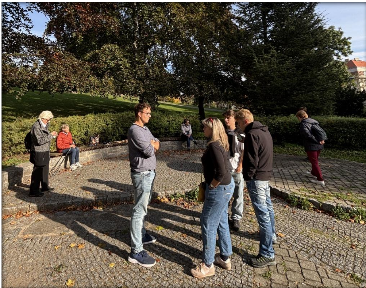
Přednáška o stromech ve městě, realizováno z prostředků Mládež kraji, říjen 2024

Klíčový výstup a příklady realizovaných aktivit: Podpora veřejně prospěšných iniciativ mladých lidí, které přinášejí inovace do škol i veřejného prostoru. Sportovní den pro děti, výsadba stromů v parku Ivana Jilemnického s přednáškou na Den stromů, Časopis Dialog, Den jógy.