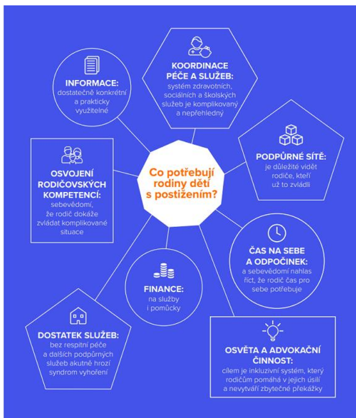
Tabulka č. 14 Systematický přehled empirických studií o potřebách rodin dětí s postižením nebo chronickým onemocněním. Schola Empirica pro Nadační fond Avast, 2019. Zdroj: https://cdn2.hubspot.net/hubfs/486579/foundation-files/spolu_do_zivota_prehled_empirickyh_studiij.pdf